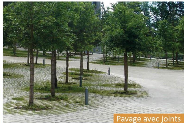
Pavage avec joints ouverts