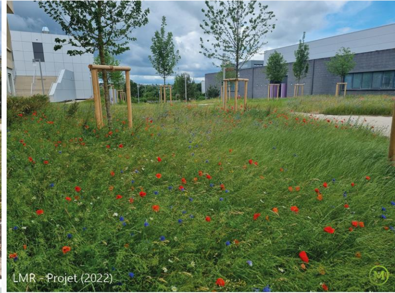
LMR - Projet (2022)