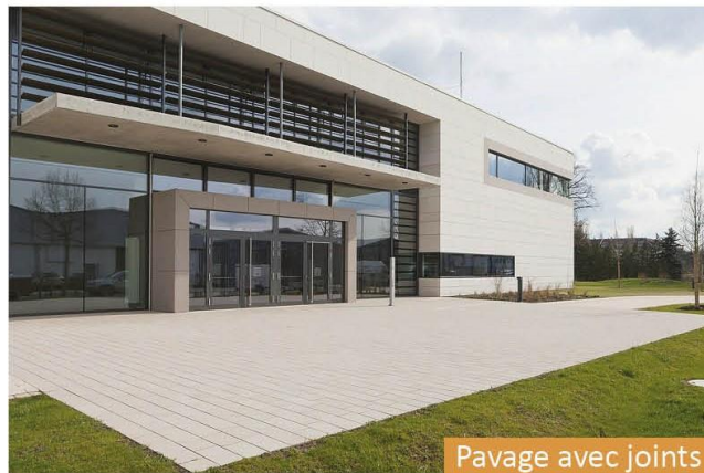
Pavage avec joints fermés