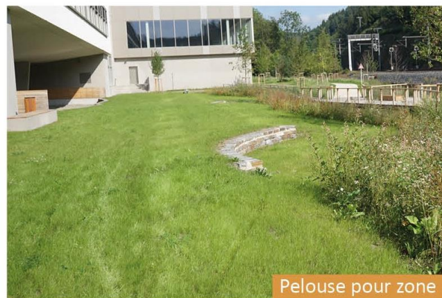
Pelouse pour zone récréative