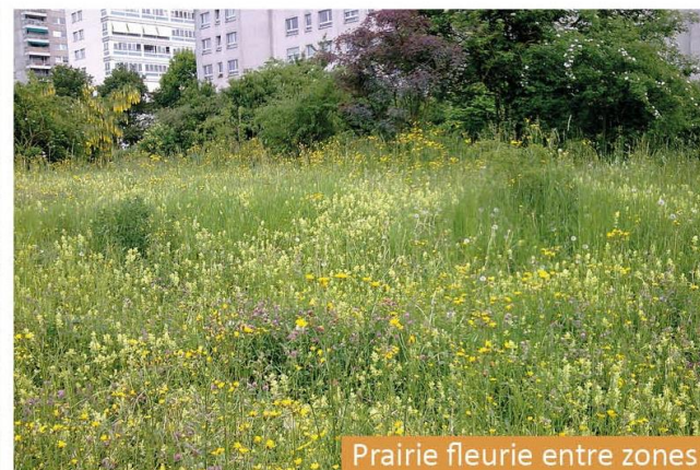
Prairie fleurie entre zones pelouses et biotope