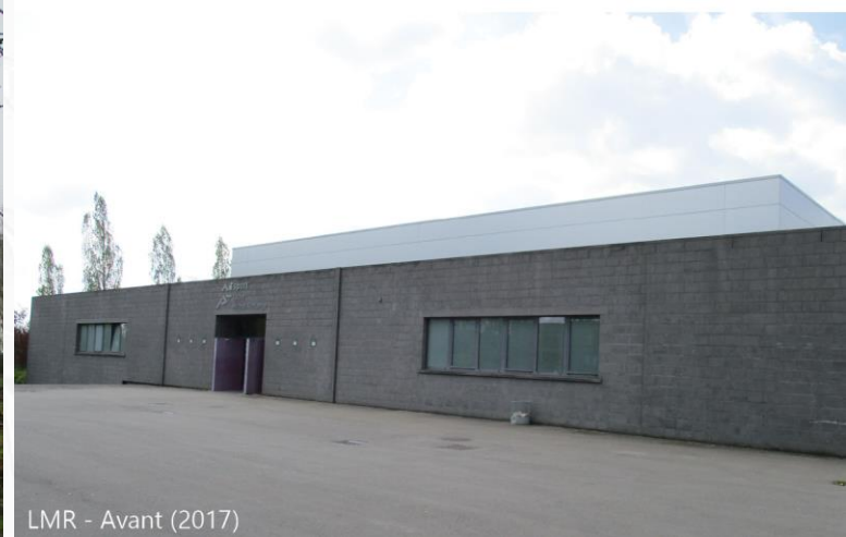
LMR - Avant (2017)