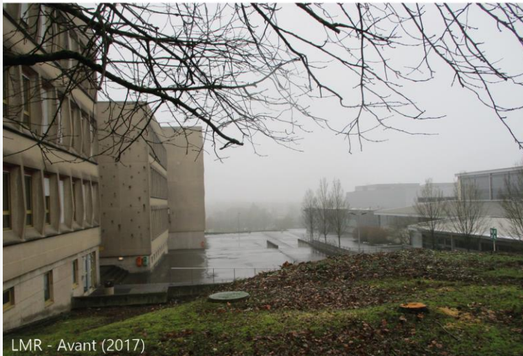
LMR - Avant (2017)