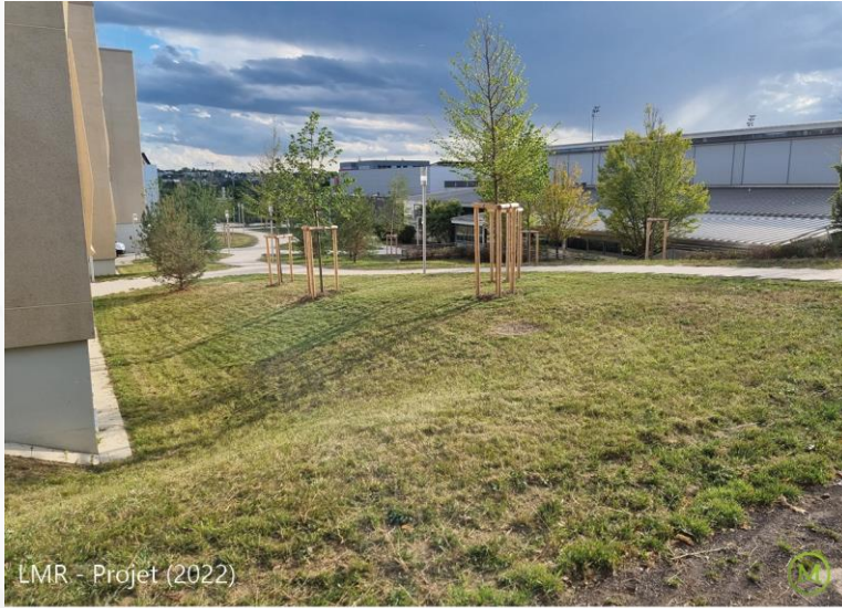
LMR - Projet (2022)