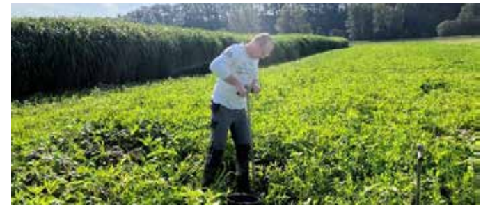
Im September wurden die ersten Bodenproben entnommen

Naherholung: Das Argument der Naherholung mag einigen weit hergeholt erscheinen. Doch wird in so manchen Veröffentlichungen eine positive Wirkung auf das menschliche Wohlbefinden hervorgehoben. Ist nicht der Gedanke an eine grüne und vielleicht sogar blühende Parzelle nicht durchaus sympathischer als die Vorstellung eines nackten Ackerbodens?!