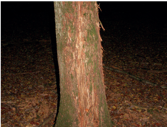
Reviermarkierung durch Hirsch(stier)

Eine gezielte Reduzierung der Schalenwildbestände ist aus Natur-, Umwelt- und Klimaschutzüberlegungen sowie aus Sicht des Tierschutzes demnach dringend notwendig, um die Naturverjüngung sowie Neupflanzungen und somit die Zukunft unserer Wälder zu erhalten.