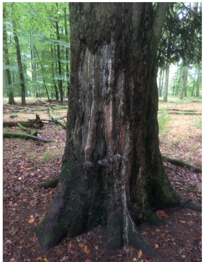
Massive Schäden von Rothirsch an Douglasie (Rouscht 2019)