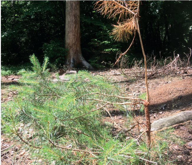
Fegeschäden an Waldkiefer durch Rehbock