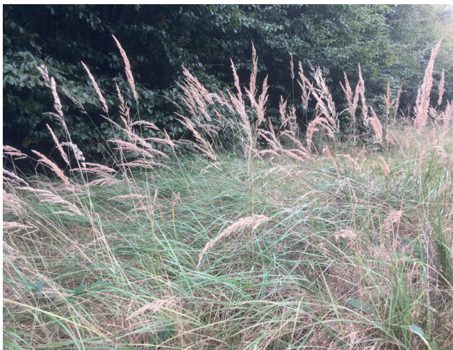
Die rauen Blätter des Waldreitgrases werden von Reh und Hirsch verschmäht, so dass sich diese Art besonders auf den tonigen Keuperböden durchsetzt und der dichte Wurzelfilz eine spätere Naturverjüngung gefährdet (Waldreitgras, 2019)