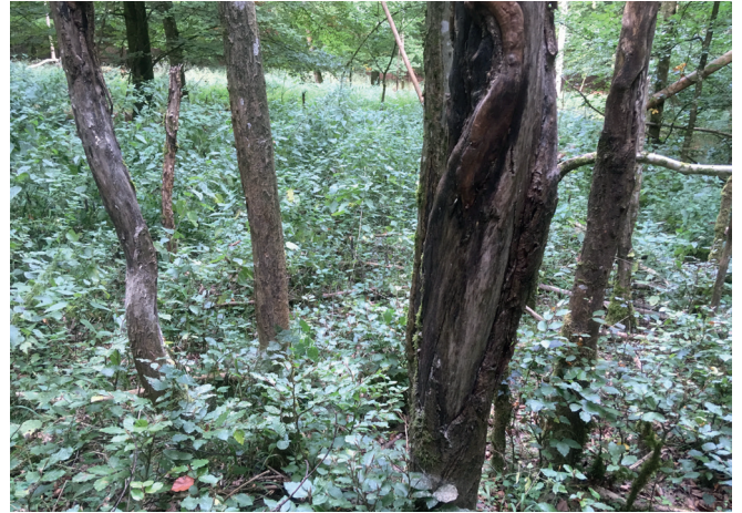
Schälwunden an Eschen durch Rothirsch (Rouscht 2018)

Zusammengefasst: zu viel Wild frisst gerade jene Jungbäume bzw. Eichen und Buchecker auf, die dringend ältere absterbende Bestände ersetzen sollten.