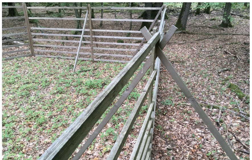
Mittels Weisergatter lässt sich der Druck des Schalenwildes auf die Naturverjüngung veranschaulichen (Weisergatter in einem Stieleichen-Hainbuchen Bestand, Friemholz bei Echternach, 2019)

Diese Fakten sollten auch mit den im Folgenden genannten wissenschaftlichen Instrumenten vermittelt werden.