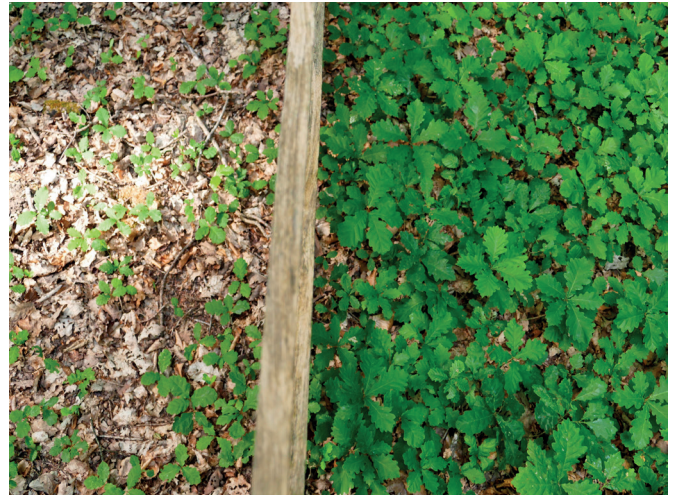
Das Fehlen jeglicher Jungeichen außerhalb des Gatters zeigt den hohen Wildbestand. Wieviel dem Frassdruck der Wildschweine auf die Eicheln beziehungsweise der Rehe auf die Jungeichen geschuldet ist, lässt sich hier nicht erkennen. Detailaufnahme innerhalb (links) und außerhalb (rechts) des Gatters

Die zahlreichen Wildschweine ihrerseits lieben Eicheln und Buchecker, sodass auch die Fortpflanzung von Bäumen auf diesem Wege aufgrund zu hoher Wildschweinebestände, nur noch sehr begrenzt erfolgen kann.