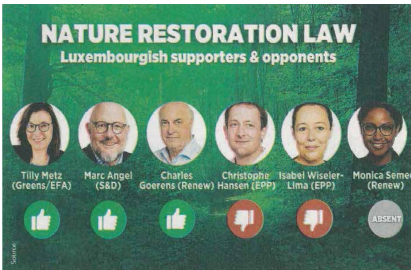
Eine Illustration aus dem Lëtzeburger Land (21.07.2023) brachte das Votum auf den Punkt

Weitere Informationen finden Sie auf der Internet-Seite des Mouvement Ecologique: www.meco.lu .