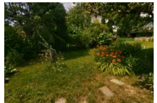
Ee Gaart mat ville Strukturelementer (Gehëlz, Steeköip, Staudebeeter, Blumeninselen, etc...) bitt net just de MÛnschen déi hei liewen, ma och den aneren Déieren a Planzen een interessant Ëmfeld a fërdert d'Aarteivillfalt.