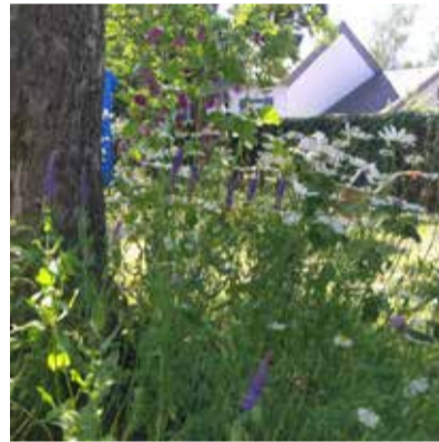
An dësem Gaart fannen d'Beien an d'Pãiperleken ee Mier u giele Bléien. Awer och am Schied vum Bam wissst eng Villfalt u faarwege Kräider.