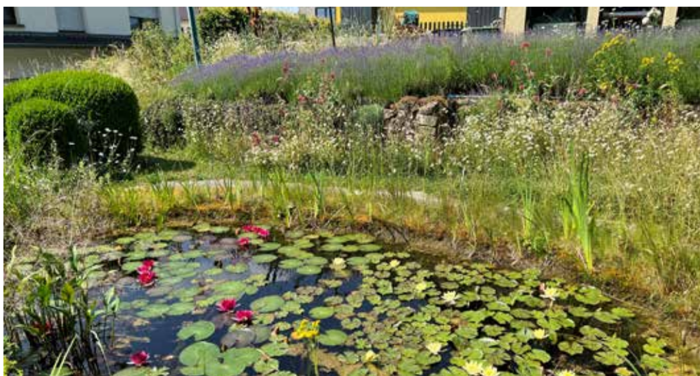
Vu Waasserplaze profitéieren net just Waasser-Déieren a Planzen. Och Vullen, kleng Mamendéieren a Land-Insekte kommen heihinner drénken.