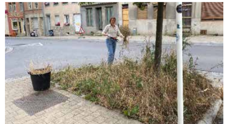
Dës Bamscheiw zu Nomern gouf virun e puer Joer mat Wëllblummesom ageséit.

D'Planzegesellschaft, déi sech hei ugesidelt huet ass net statesch, ma verännert sech iwwert d'Joren.