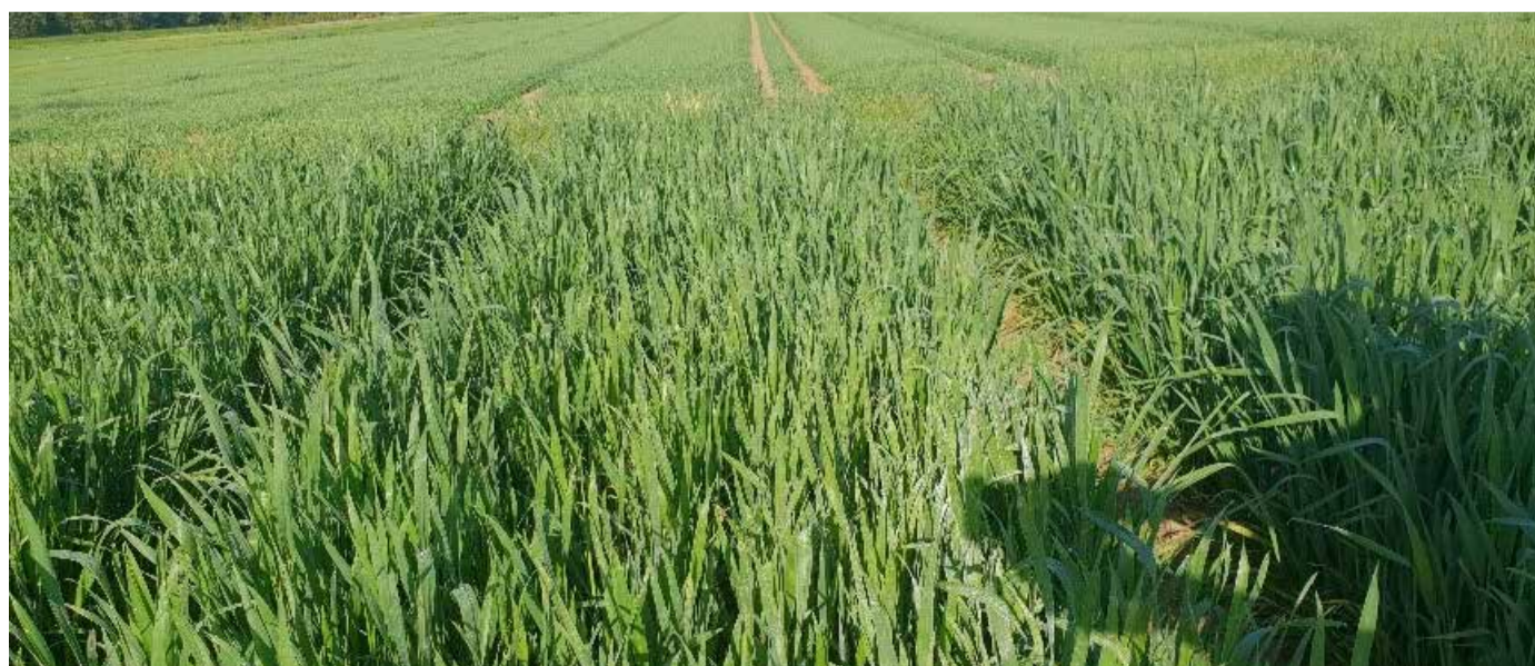
Ausdauernder Weizen auf dem Versuchsfeld der LTA in Bettendorf