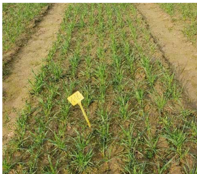
Bestockung der Versuchsparzelle

Das Oekozenner Pafendall wird die Entwicklungen im Auge behalten und in Zusammenarbeit mit der LTA weitere Versuche mit aussichtsreichen alternativen Kulturen in Bettendorf durchführen, um ihnen in Luxemburg eine Zukunft zu verschaffen.