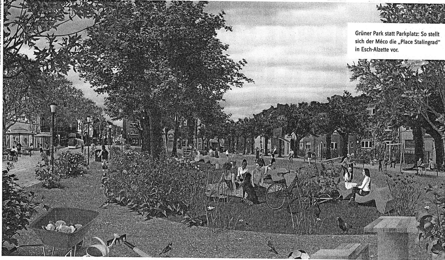
Grüner Park statt Parkplatz: So stellt sich der Méco die „Place Stalingrad“ in Esch-Alzette vor.

tellitenmessungen: Die Oberflächentemperatur in Luxemburg ist in Parks rund 10 Grad kühler als auf bebauten Flächen. Zu beachten ist hierbei allerdings, dass die Unterschiede in der Lufttemperatur nicht so stark sind.