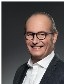
Energie- a Landesplanungsminister / Ministre de l'Énergie et de l'Aménagement du Territoire Claude Turmes

Den gesamten integrierten Nationalen Energie- und Klimaplan finden Sie hier: