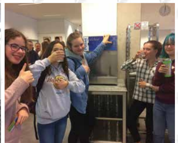
Wasserspender, statt Plastikflaschen in unseren Schulen