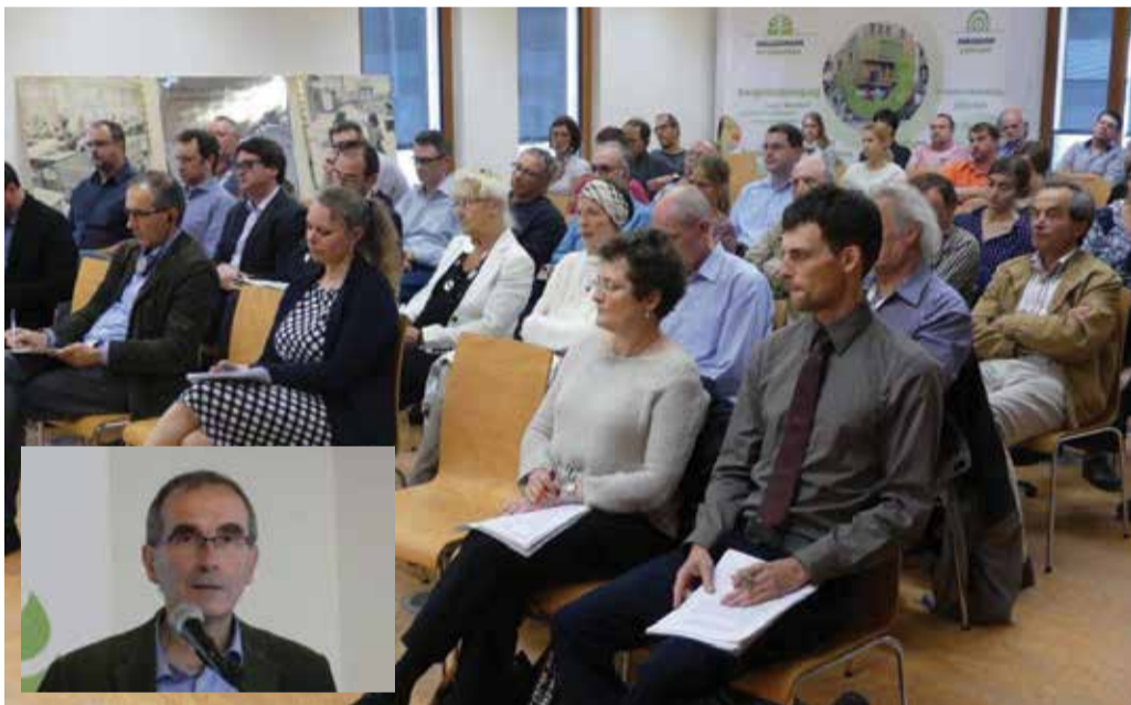
Eine interessierte Zuhörerschaft verfolgte am 13. Juni einen interessanten Informationsabend des Mouvement Ecologique zum Thema «Aktionsplan Pestizide». Neben der Vorstellung der vom Mouvement Ecologique in Auftrag gegebenen Analyse des Planes durch François Veillerette, Direktor von «générations futures» nahmen auch Landwirtschaftsminister Fernand Etgen und Umweltministerin Carole Dieschbourg an einer lebendigen Debatte teil.

Der Entwurf in der vorliegenden Form stellt die aus Umwelt-, Naturschutz- und Gesundheitssicht absolut notwendige Reduktion des Pestizideinsatzes nicht sicher. Im Gegenteil: der Aktionsplan kann eher als ein „weiter wie bisher“ angesehen werden. Wir veröffentlichen im Folgenden - ob der Wichtigkeit - die kritische Stellungnahme des Mouvement Ecologique!