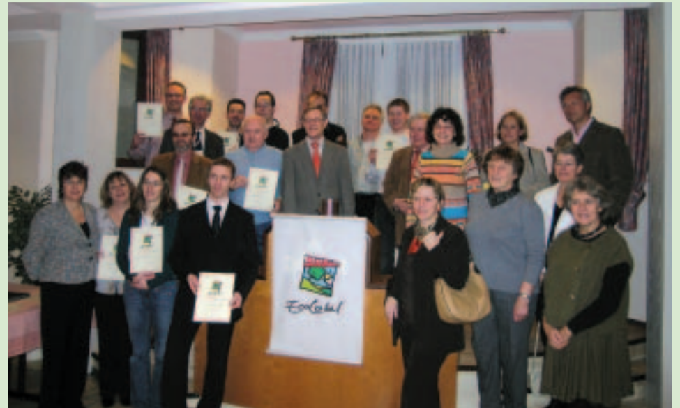
Fernand Boden, Minister für Mittelstand und Tourismus, überreichte im Hotel Dahm den Vertretern der Betriebe die EcoLabel-Urkunden.