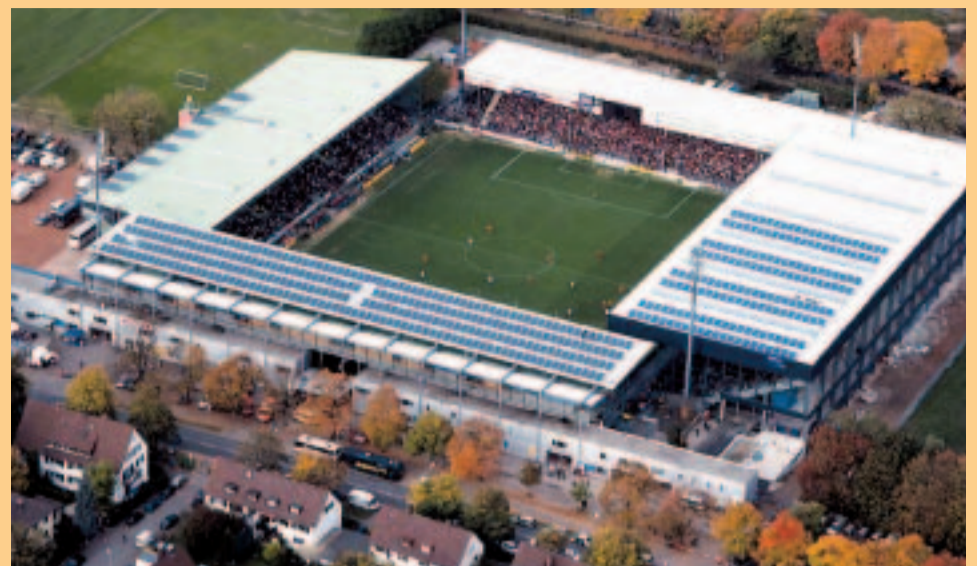
Wurden in den staatlichen Berechnungen für den Ausbau der erneuerbaren Energien in Luxemburg tatsächlich alle Möglichkeiten ausgeschöpft?

Ende letzten Jahres wurde vom Wirtschaftsministerium ein erster Entwurf einer Potenzialstudie für erneuerbare Energien vorgestellt. Während der offiziellen Vorstellung wurde dargelegt, was technisch und theoretisch möglich wäre sowie was hingegen technisch und politisch wirklich machbar ist. Hierbei legten die Autoren der Studie aber nicht dar, welches die politischen / fachlichen Hypothesen waren, die vom «technischen» zum «machbaren» führten. Der Mouvement Ecologique fragte darauf-