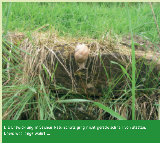
Die Entwicklung in Sachen Naturschutz ging nicht gerade schnell von statten. Doch: was lange währt ...

Der Mouvement Ecologique richtet deshalb einen dringenden Appell an den Umweltminister, die Forstverwaltung grundsätzlich zu reformieren. Es gab bereits erste Analysen – die unter der vorherigen Regierung erstellt wurden – wie diese Reform erfolgen könnten. Diese