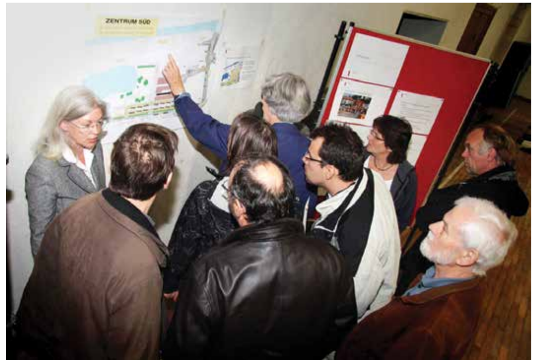
Ein zentrales Viertel in der Ortschaft muss umgestaltet werden... kein Problem. Im Laufe eines Jahres wurden die BürgerInnen und die ökonomischen Akteure einbezogen... und nach einem Jahr lag ein Konsens resp. ein Plan vor, der von der Mehrheit getragen wurde und in dessen Erstellungsprozessdem jeder auch die Sichtweise des anderen kennen lernte. Wie weit entfernt ist dies von der Planung bei so manchem Projekt in Luxemburg, wo Gemeinde oder Staat monate- oder jahrelang alleine hinter verschlossenen Türen planen, und sich dann wundern, wenn die BürgerInnen das Projekt nicht mit tragen. Viel schneller, effizienter und demokratischer geht es gemeinsam mit den BürgerInnen. Wann setzt sich diese Erkenntnis auch bei uns durch?