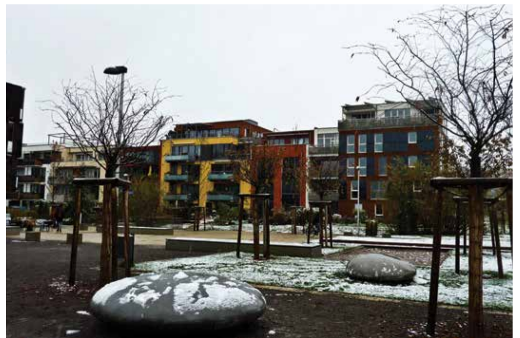
Sozialräume in den Vierteln, unterhalten von den EinwohnerInnen: Keine freistehenden Häuser mit links und rechts 3 Meter Rasenflächen, keine "Lotissements" ohne Herz und Sozialräume: Vielfalt und Lebendigkeit bestimmen das Bild!