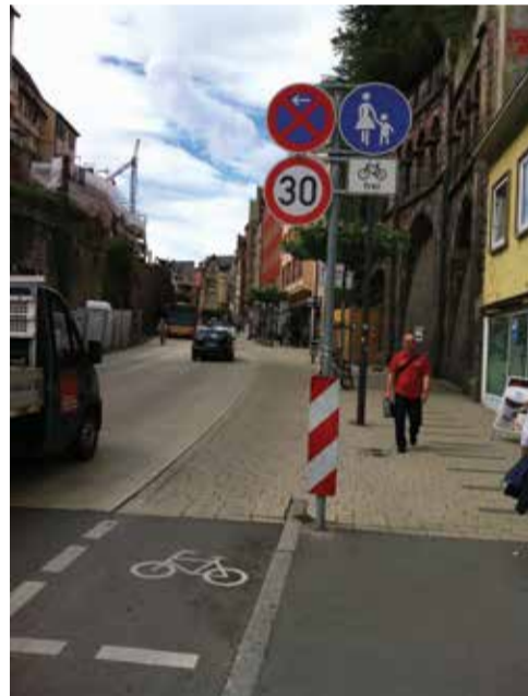
Eine sehr stark befahrene Durchgangsstraße in Tübingen: zu schmal, um zusätzlich zu dem bestehenden Individualverkehr auch noch gute Bedingungen für Radfahrer und Fußgänger zu schaffen. Die Lösung: Priorität für Fußgänger, Radfahrer und Bus; die Autos sollen "schauen, dass sie klar kommen und sich untereinander arrangieren". Eine Umkehr somit einer klassischen Situation. Bei einer derart stark befahrenen Straße würde man in Luxemburg sagen: sorry Radfahrer, eine Spur passt für euch nicht mehr rein... Tübingen weist auf, dass das Gegenteil geht.