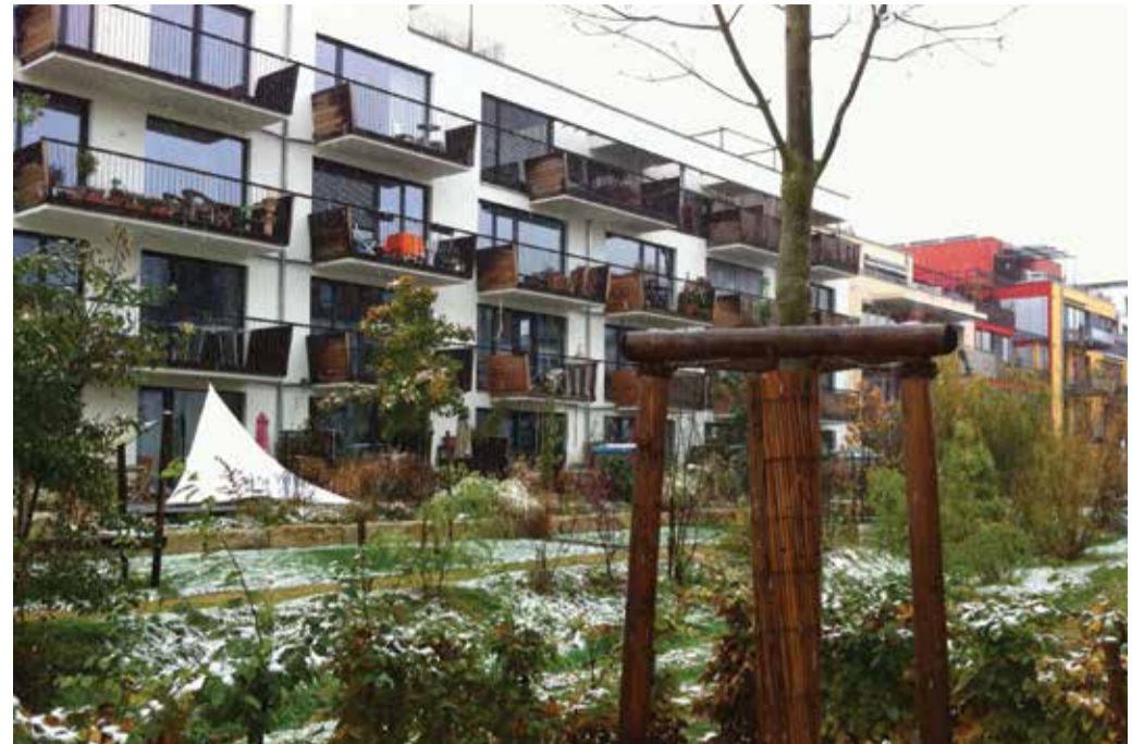
Harmonische und bereichernde architektonische Vielfalt: geplant von den BürgerInnen – ausschließlich verbunden mit Vorteilen für die Gemeinde. Diese gibt Kriterien vor (soziale Durchmischung u.a.m.) und setzt darauf, dass die BürgerInnen diese Prinzipien der Stadtentwicklung besonders kreativ umsetzen. Mit durchschlagendem Erfolg. Wer durch diese Tübinger Viertel geht, kann nur staunen.

Sie finden einige Informationen zu der Besichtigung wie auch Fotos auf der Webseite des Mouvement Ecologique www.meco.lu .