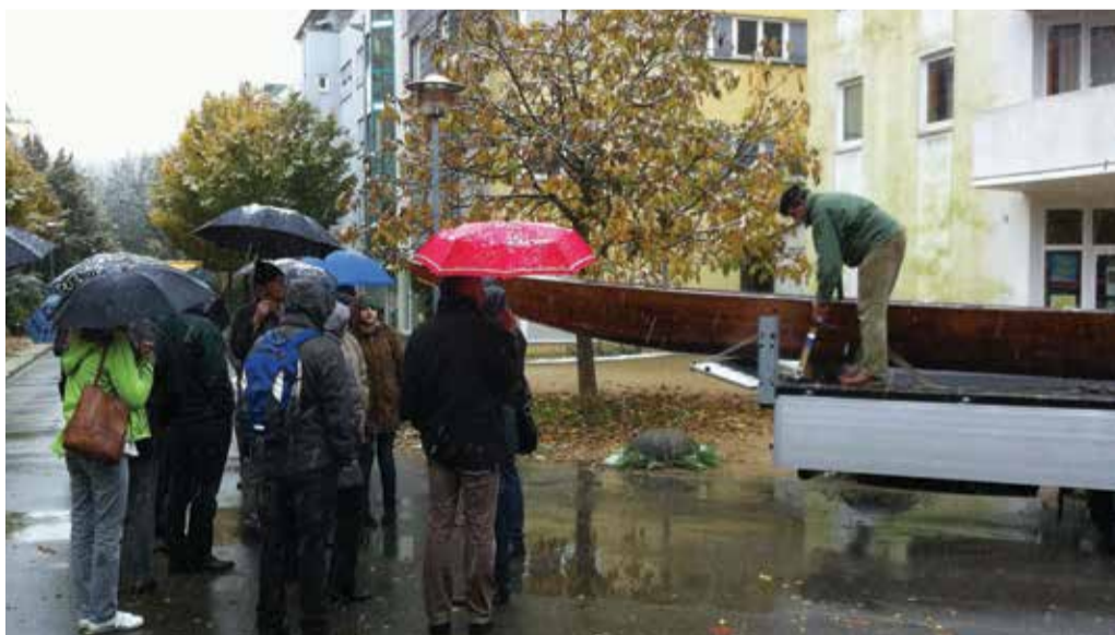
2. Wir staunten nicht schlecht, als mitten im Wohnviertel ein kleineres Boot auftauchte... Dabei ist der Grund für Tübinger ganz banal: im Kern des Wohnviertels befindet sich ein Schreiner, der auch kleinere Boote repariert. Dies scheinbar absolut im guten Einverständnis mit den Nachbarn. In Luxemburg derzeit kaum vorstellbar. Kinder können mal dem Schreiner über die Schulter schauen, ein Vogelhaus das kaputt ist wird auch mal gratis für den Nachbarn repariert.... Gelebte Durchmischung im Stadtviertel!