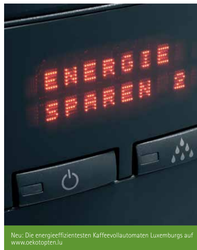
Neu: Die energieeffizientesten Kaffeefullautomaten Luxemburgs auf www.oekotopten.lu