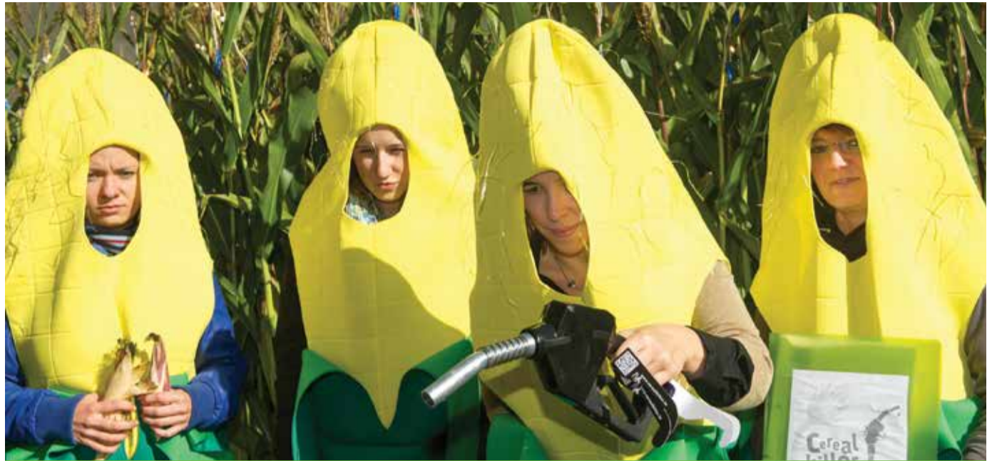
Zweibeinige Maispflanzen informierten über die verheerenden Folgen des Einsatzes von Agro-Treibstoffen – eine Aktion die von der Luxemburger Künstlerin Neckel Scholtus entwickelt wurde.

Agrokraftstoffe (Biosprit, Agrofuels) gehören zu den umstrittensten Instrumenten der europäischen Klima- und Energiepolitik. Laut der EU-Direktive von 2009 über die Förderung der Erneuerbaren Energien sollen die EUMitgliedsstaaten bis 2020 10% des gesamten Energieverbrauchs im Verkehrssektor aus erneuerbaren-