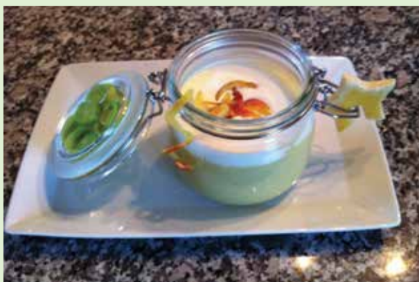
2. Platz geht an Elise Reiser-Rampin für ihre Variante der „Schaumeg Rieslings-Gromperenzëppchen mat Trüffelueleg“