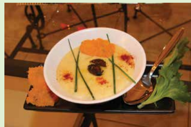
Der 3. Platz geht an Iwona Mastalska, ebenfalls für ihre Interpretation der „Gromperenzëppchen“