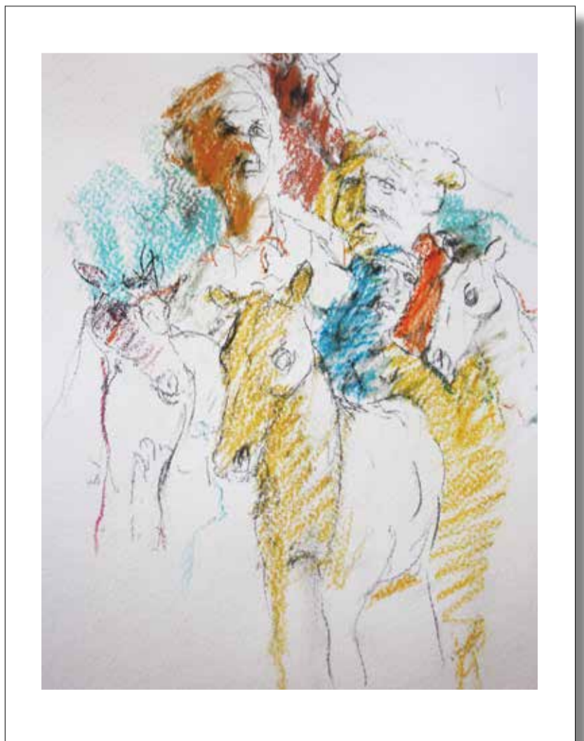
"En mouvement": der neue Siebdruck des bekannten Künstlers Ch. Reinertz (Foto des Motivs, der Siebdruck in Originalfarben - die gegenüber dem Foto leicht variieren - ist im OekoZenter erhältlich) !

Abholung beim Mouvement Ecologique, 4, rue Vauban, L-2663 Luxembourg. Bezahlung vor Ort nur mit Bargeld.