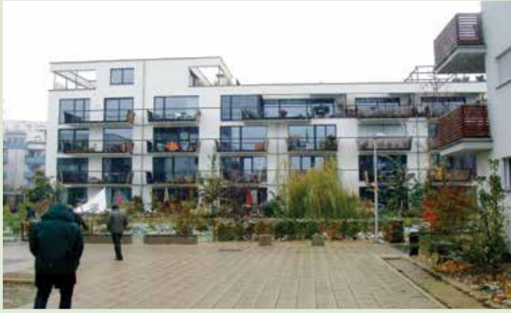
Mouvement Ecologique und Oekozer Lëtzebuerg in Zusammenarbeit mit dem Syvicol, der «Fondation de l'architecture et de l'ingénierie Luxembourg» sowie unter der Schirmherrschaft des Ministeriums für Wohnungsbau, des Innenministeriums sowie des Ministeriums für nachhaltige Entwicklung laden herzlich ein zu der Veranstaltung