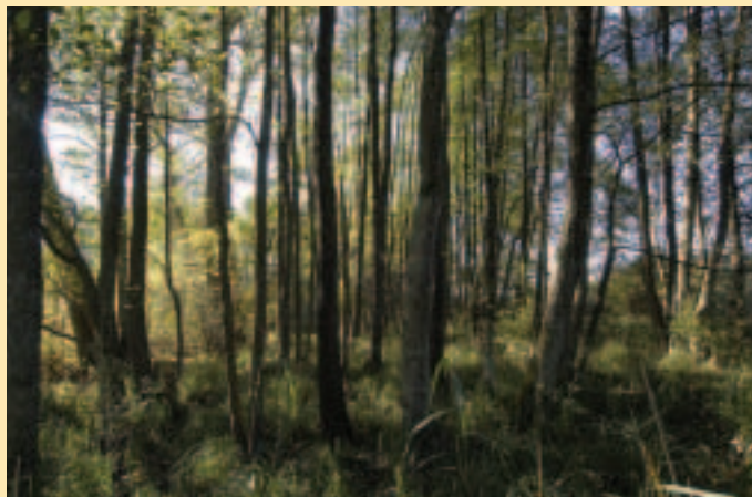
Überreste eines Auwaldes entlang der Weißen Ernz

Darüber hinaus fordert der Mouvement Ecologique, dass die Naturschutzpolitik in Zukunft durch fachlich fundierte, präzise Vorgaben des