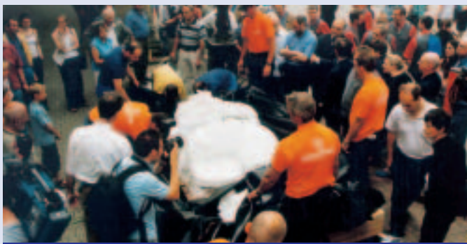
Energieeinsparmöglichkeiten gibt es ausreichend ... wie das Beispiel des "Eishauses" gezeigt hat. Nur scheint so mancher Verantwortliche noch nicht bereit, diese Möglichkeiten wirklich auszuschöpfen.