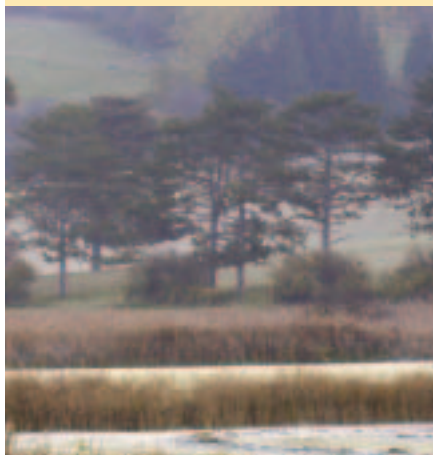
weite Schilfflächen und Feuchtwiesen, die in dieser Ausdehnung und