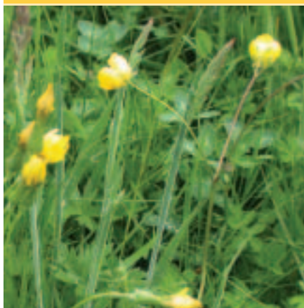
bedroht und kommt ausschließlich in nährstoffarmen Feuchtwiesen vor. Intrag und Trockenlegen der Wiesen gefährdet. Die meisten Populationen et. Der Koedinger Brill ist eine der wenigen Stellen in Luxemburg wo

Die erwähnten Verträge mit der Landwirtschaft stellen aus naturschutzfachlicher Sicht die optimale Schutzmaßnahme dar, so dass hier kein weiterer Handlungsbedarf gesehen wurde. Kein Wunder: Wie kann man Gebiete "renaturieren", die bereits zu den ökologisch hochwertigsten Luxemburgs gehören?