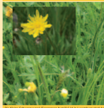
Die Kleine Schwarzwurzel (Scorzonera humilis) ist in Luxemburg stark bedroht. Sie ist eine typische Art der Pfeifengraswiesen und ist durch Nährstoffeintrag in Luxemburg überaltert und ihr Fortbestand ist langfristig gefährdet. Jungpflanzen dieser Pflanzenart sind noch etablieren können.