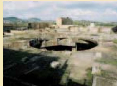
Fondation du Haut Fourneau C Fundamente des Hochofens C

Il est prévu de détruire des éléments importants du plateau des Hauts-Fourneaux à Belval-Ouest (voir photos). Le Mouvement Ecologique s'oppose à cette démolition: avec l'argent que le Gouvernement veut investir dans ce site, une conservation et une valorisation plus adéquates du site seraient possibles. Le plateau ne doit pas être réduit à un site banal, sans «cœur» et sans identité. Nous optons pour un quartier urbain qui reflète les particularités et l'histoire du Bassin