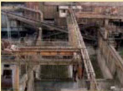
Bassins de granulation du laitier Granulierbecken der Schlacke C