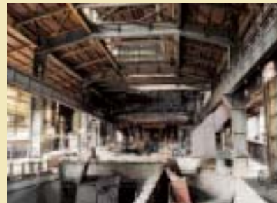
Halle de coulée Haut Fourneau B Gießhalle des Hochofens B