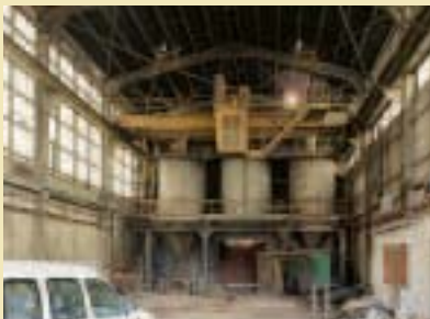
Bâtiment de la masse noire Gebäude der Schwarzen Masse