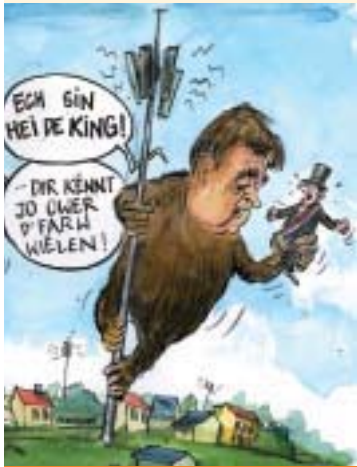
es nach dem Staat, könnten die Gemeinden - so wie tatsächlich im Fall der Antennen entscheiden!

ger bereits bei der Ausschreibung einer PAP-Prozedur (PAP = Plan d'aménagement particulier) Stellung zu diesem Projekt beziehen können und nicht erst bei Erteilung einer Kommodo-Inkommodo-Genehmigung. Dies war bedauerlicherweise in der Vergangenheit in den wenigsten Fällen die Regel.