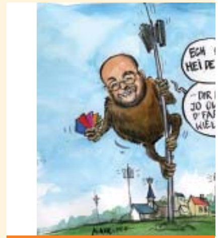
Der staatliche Entwurf betreffend GSM-Antennen: ginge es nach dem staatlichen Plan vorgesehen – lediglich noch die Farben der Antennen

Das Innenministerium sieht dies anders: es wäre nun einmal schwierig ("non réaliste" bzw. "non pertinente") einen graphischen Plan mit den zukünftigen Standorten zu erstellen, da man noch nicht wisse, wo Antennen implantiert werden ... Mit Verlaub, was ist dann Ziel und Zweck dieses sektoriellen Planes? Skeptische Beobachter gewinnen den Eindruck, als ob es einzig und alleine darum ginge die Gemeinden jedweder