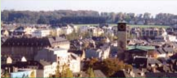
CO2-Einsparung in Luxemburg: es bleibt viel zu tun, siehe Beispiel Altbauernierung

Im Rahmen der Debatten um den sogenannten CO2-Allokationsplan bezog der Mouvement Ecologique in den vergangenen Wochen mehrfach Stellung. Dieser Plan ist in der Tat von fundamentaler Bedeutung für die Entwicklung Luxemburgs, soll doch festgelegt werden, wer wieviele Rechte auf CO2-Emissionen hat: vom Verkehr über die Betriebe bis hin zum Wohnungsbau. Nicht umsonst wird z.T. davon gesprochen, dass die Debatte über den CO2-Allokationsplan von ebensolcher fundamentaler Bedeutung ist, als die Frage "Wéi e Letzebuerg fir muer". Jedoch lässt die Art und Weise, wie das Thema angegangen wird zu wünschen übrig. Der Mouvement Ecologique äusserte eine fundierte Kritik – brachte aber auch konkrete Vorschläge betreffend die weitere Vorgehensweise ein. Im folgenden sei aus Pressemitteilungen zitiert: