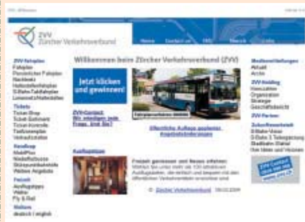
Auszug aus der homepage des Verkehrsverbundes Zurich, der in Luxemburg vorgestellt wird

am Mittwoch, den 17. März um 18.30 im Casino Syndical in Luxemburg-Bonneweg mit Dr. Kagerbauer, Direktor des Verkehrsverbunds Zürich